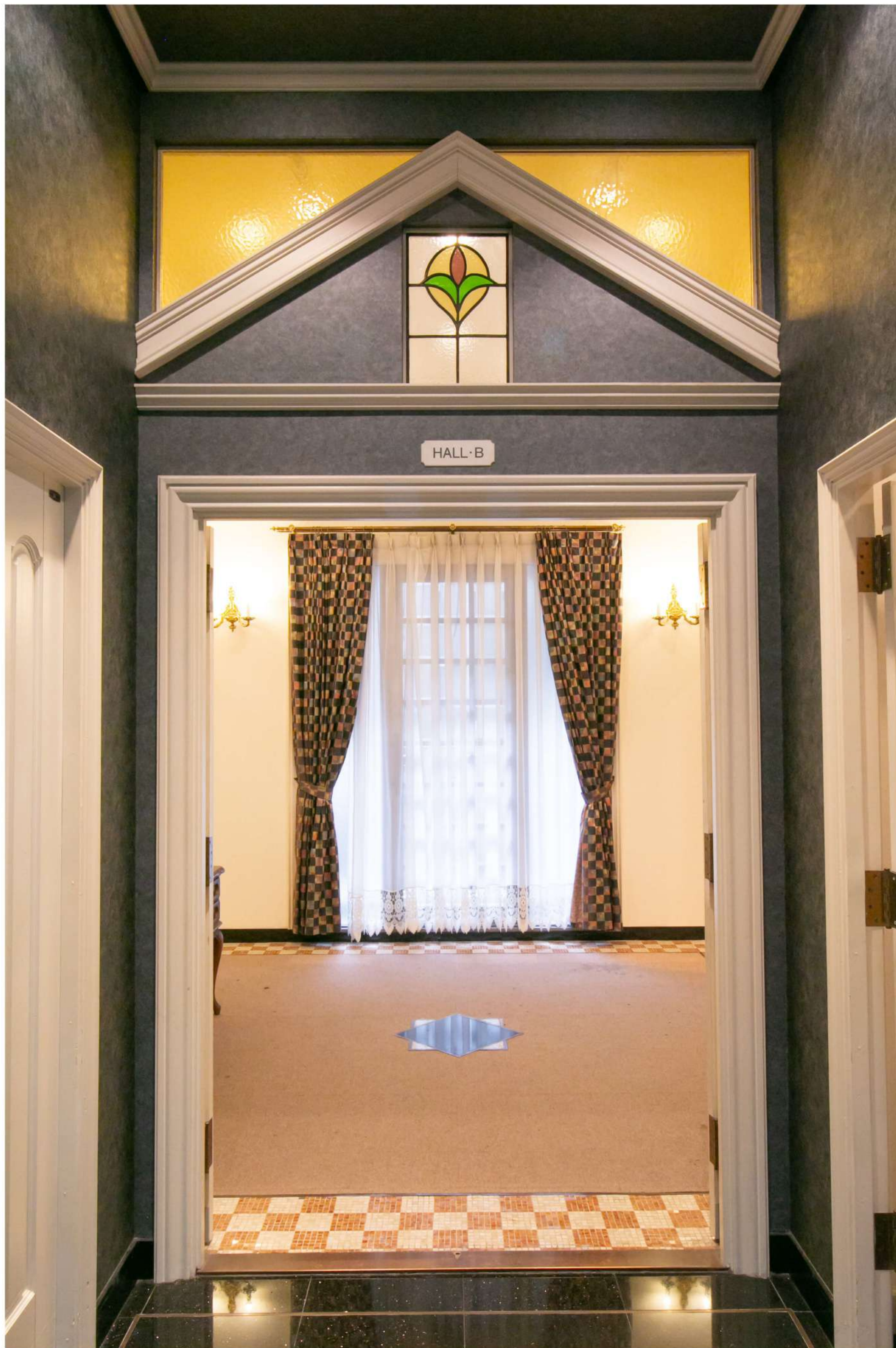
●写真1 ホールB入り口