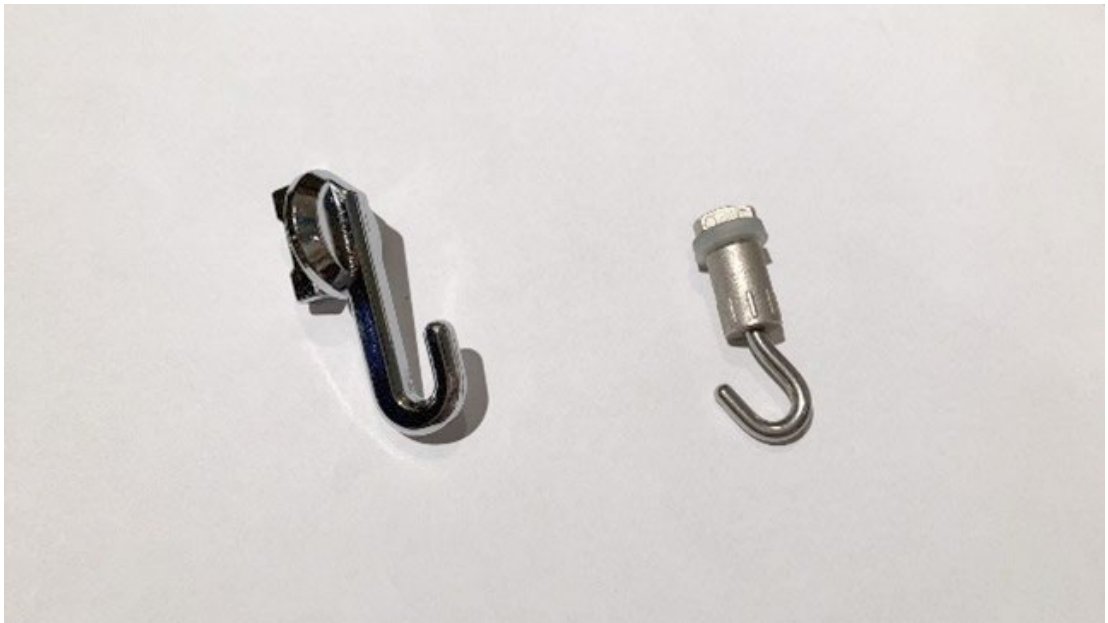
写真左：こまどり専用ピクチャーレールフック

カーテンレールのようにスムーズに横移動いたしませんので、ピクチャーレールフックは目的の場所へ取り付けてください。数センチの微調整は可能です。その場合、フックを持ちながら横にずらしてください。