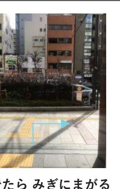
でたら みぎにまがる