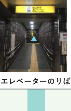
エレベーターのりば