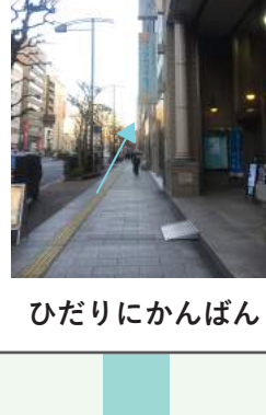
ひだりにかんばん