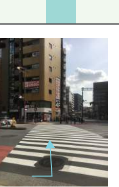
ひだりでの おうだんほうどうわたる