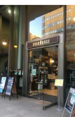
おみせ とうちやく!